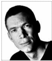
LEDER Af Benjamin Holst, redaktionschef