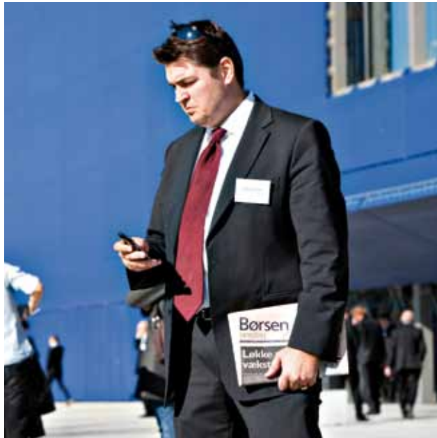
Et medlem af Institut for Selskabsledelse til årsmødet i Danmarks Radios koncerthus.

"Jeg synes ikke, kommunale og regionale ledere bør være medlemmer af sådanne lukkede og elitære grupper. Formålet med at invitere dem er, som jeg fortolker det, at øve indflydelse på dem. Det er godt at være i kontakt med folk uden for rådhuset, men det skal foregå åbent, og det skal ikke være med en lille indspist gruppe," siger lektor