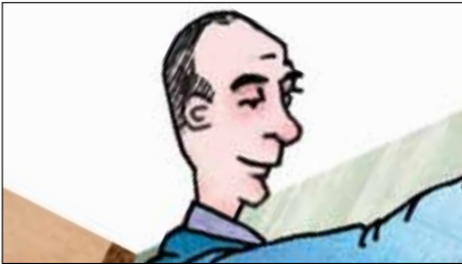
ILLUSTRATION: LARS VEGAS